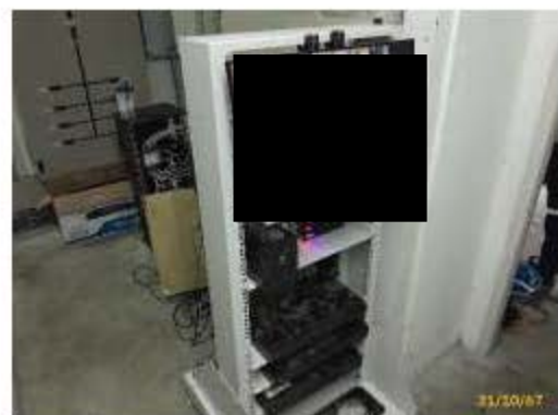
ระบบกล้องโทรทัศน์วงจรปิด