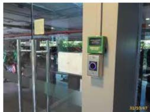
ระบบคีย์การ์ดเข้า-ออก อาคาร และระบบลิฟต์โดยสาร