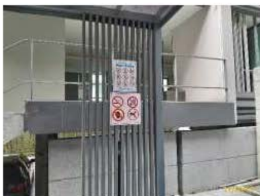
ป้ายแสดงข้อปฏิบัติสำหรับผู้ให้บริการสระว่ายน้ำ