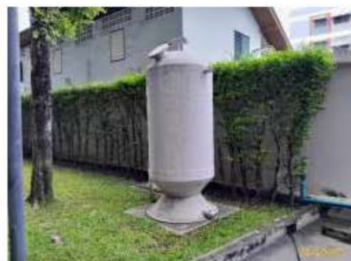
ระบบกำจัด Aerosol และระบบกำจัดมีเทน อาคาร C