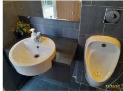
สุขภัณฑ์ประหยัดน้ำ และห้องน้ำ-ห้องส้วม