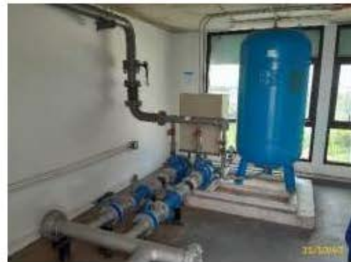
ระบบจ่ายน้ำชั้นดาดฟ้า