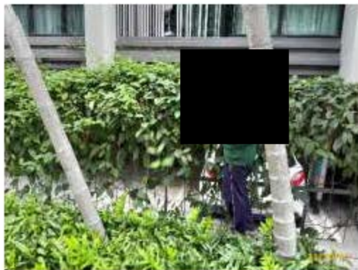
ภาพที่ 2.2-1 (ต่อ) การบริหารจัดการด้านอัคคีภัย ความปลอดภัย และการสาธารณสุข