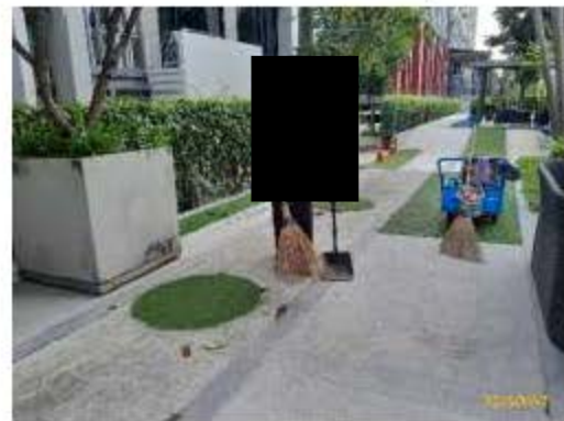
พนักงานสวนขณะปฏิบัติหน้าที่