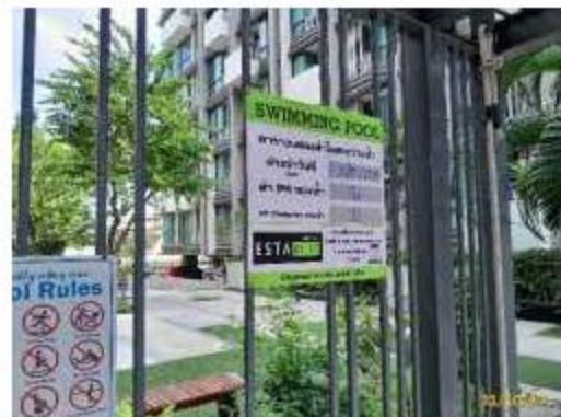
ป้ายบันทึก pH Cl สระว่ายน้ำ