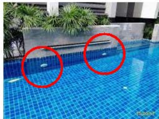
ระบบไฟฟ้าส่องสว่างบริเวณสระว่ายน้ำ