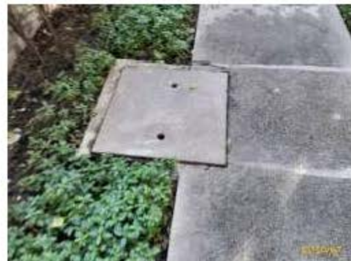
ระบบระบายน้ำและการป้องกันน้ำท่วม