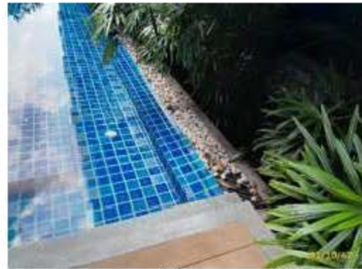
รางระบายน้ำรอบสระว่ายน้ำ