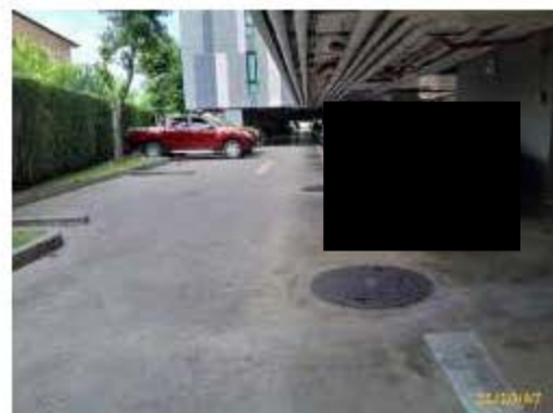
ระบบบำบัดน้ำเสียอาคาร B