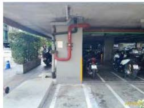
หัวรับน้ำดับเพลิงนอกอาคาร