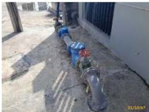
ภาพที่ 2.2-7 (ต่อ) การบริหารจัดการระบบบำบัดน้ำเสีย