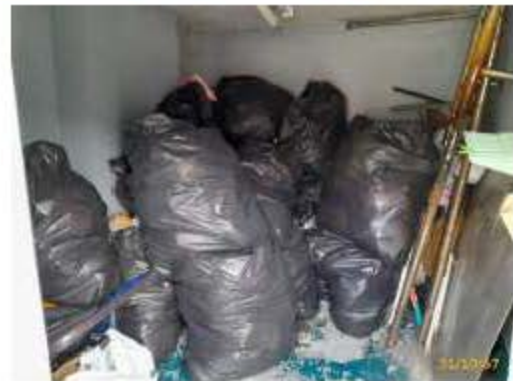
ห้องพักมูลฝอยรวม