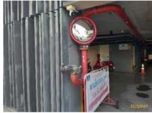
กระจกเงา