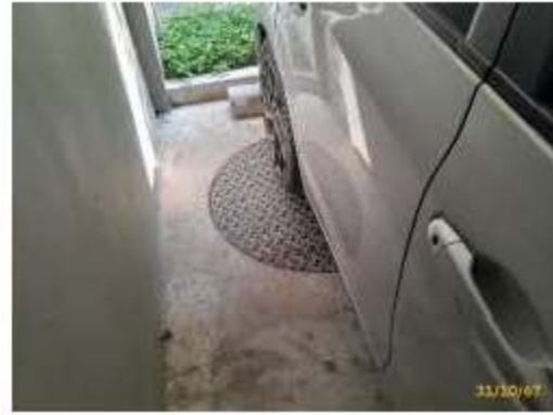
ระบบจ่ายน้ำอาคาร B