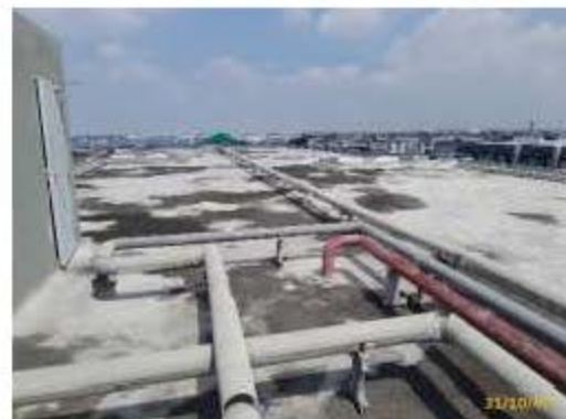
ฉนวนกันความร้อนชั้นดาดฟ้า