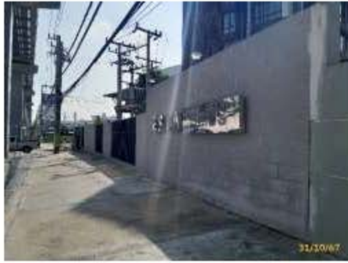
ป้ายโครงการ