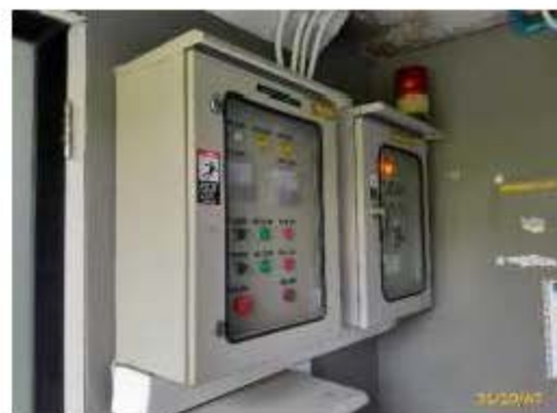
แผงควบคุมเครื่องสูบน้ำทิ้ง