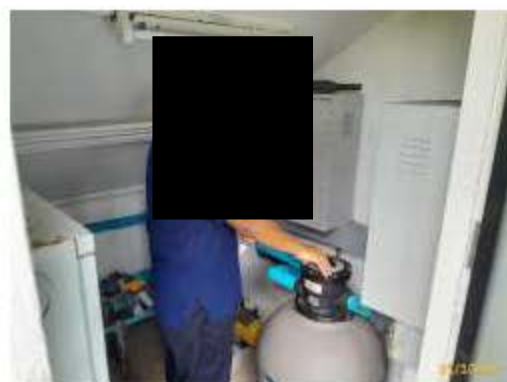
การบำรุงรักษาระบบกรองสระว่ายน้ำ