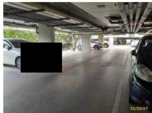
ถนนภายในโครงการ