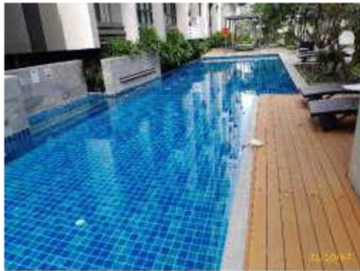
โครงสร้างสระว่ายน้ำ