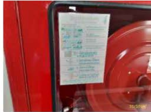
ป้ายแนะนำการใช้อุปกรณ์ระงับเหตุเพลิงไหม้