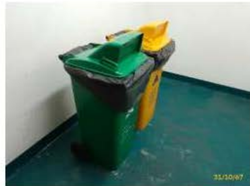
ห้องพักมูลฝอยประจำชั้น