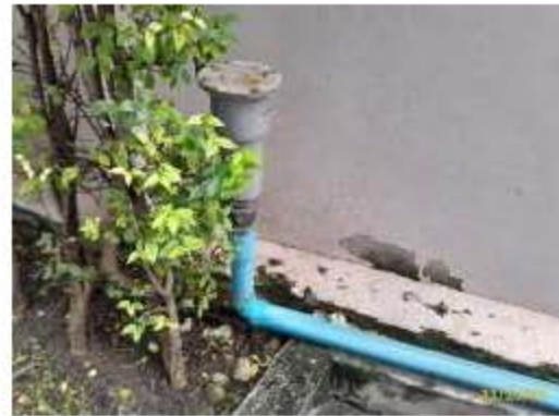
ระบบบำบัดน้ำเสียอาคาร C (ต่อ)