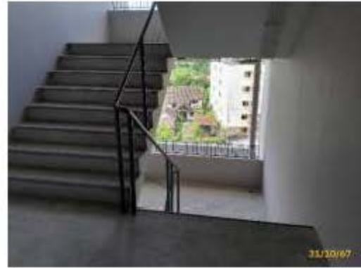
บันไดหนีไฟ (ต่อ)