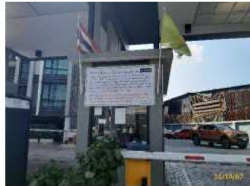
เจ้าหน้าที่รักษาความปลอดภัยประจำทางเข้า-ออก