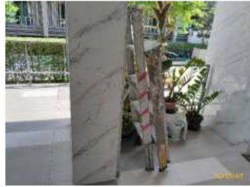
บันไดอคูมินียมทรงเอ 2 ชุด