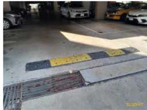
สันนูนชะลอความเร็ว