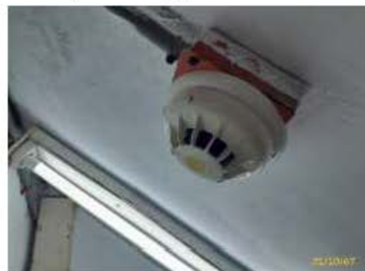
เครื่องตรวจจับควัน/ความร้อน

ภาพที่ 2.2-1 (ต่อ) การบริหารจัดการด้านอัคคีภัย ความปลอดภัย และการสาธารณสุข