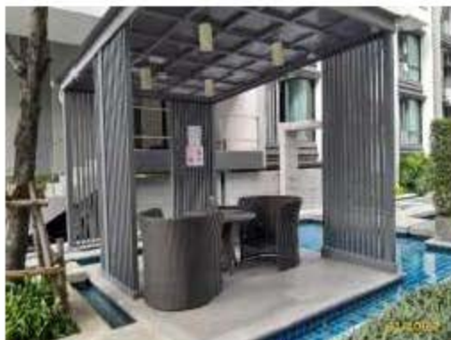
อาคารประกอบสระว่ายน้ำ