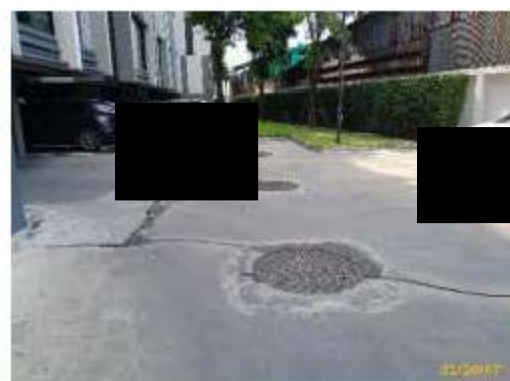
ระบบบำบัดน้ำเสียอาคาร C