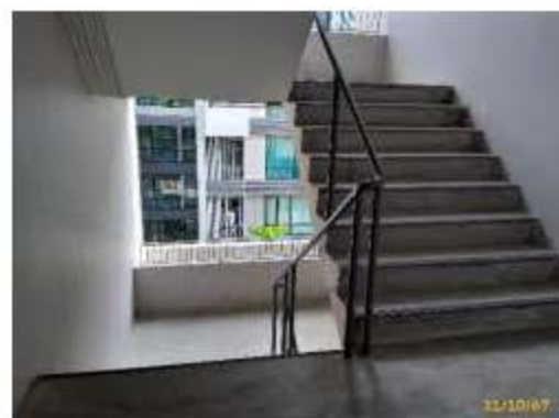
บันไดหนีไฟ

ภาพที่ 2.2-1 (ต่อ) การบริหารจัดการด้านอัคคีภัย ความปลอดภัย และการสาธารณสุข