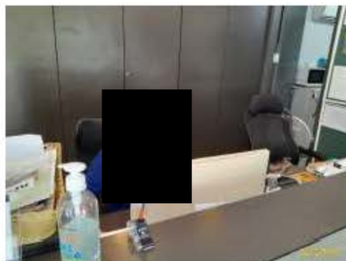
พนักงานรับเรื่องร้องเรียน