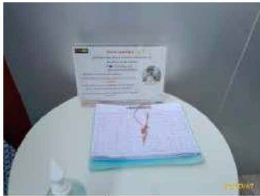
บันทึกการเข้าใช้พื้นที่ส่วนกลางและสระว่ายน้ำ