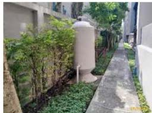
ระบบกำจัด Aerosol และระบบกำจัดมีเทน อาคาร A