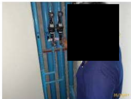
การตรวจสอบท่อน้ำใต้และท่อระบายน้ำเสีย