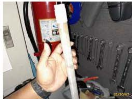
หลอดไฟฟ้า-เครื่องใช้ไฟฟ้าประหยัดพลังงาน