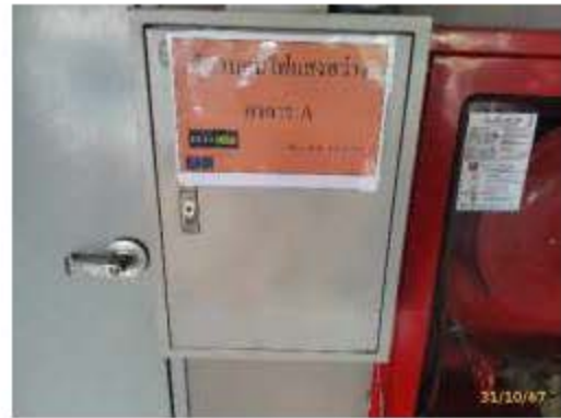
แยกสวิตช์ควบคุมอุปกรณ์ไฟฟ้าแสงสว่าง