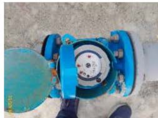
มิเตอร์น้ำประปา