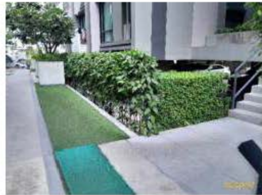
แนวเขตรั้วสระว่ายน้ำ และต้นไม้ระหว่างอาคาร A และ C (ต่อ)