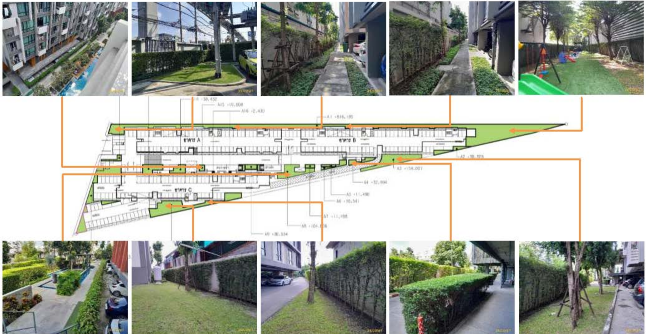
ภาพที่ 2.2-2 (ต่อ) การบริหารจัดการพื้นที่สีเขียว (พื้นที่สีเขียว)