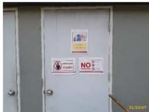
ป้าย "สถานที่เก็บสารเคมีอันตราย" "ห้ามเข้า" และ "ห้ามรับประทานอาหาร"