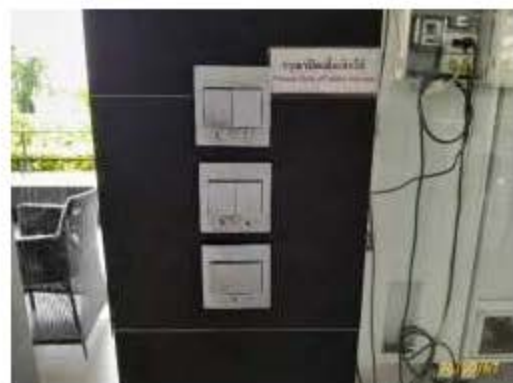
ป้ายเตือนการใช้งาน