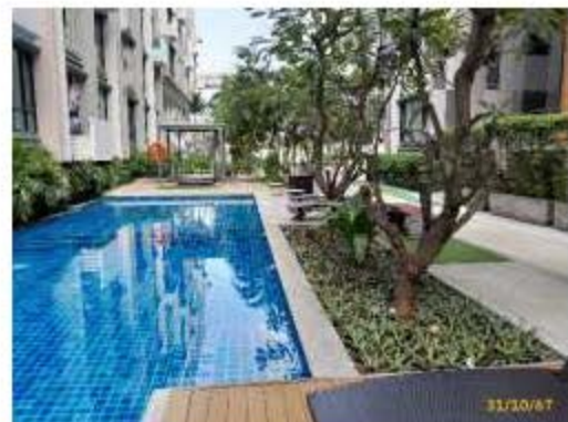
ขอบสระว่ายน้ำและทางเดินรอบสระว่ายน้ำ