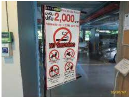
ป้ายกฎระเบียบชุมชน