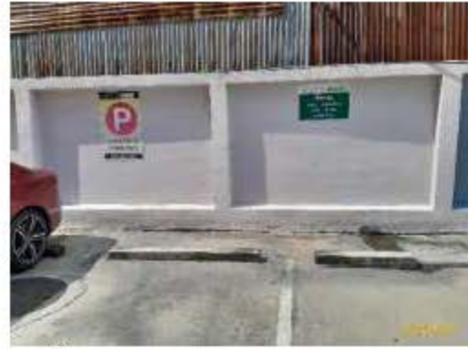
ป้ายจราจร และสัญลักษณ์บนพื้นทาง (ต่อ)