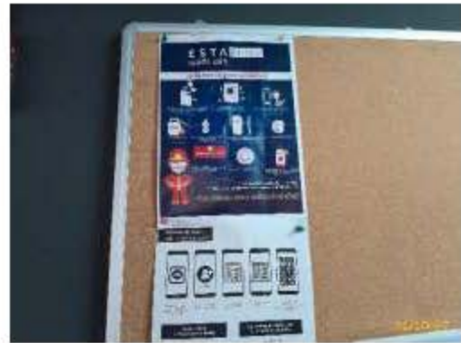
ประชาสัมพันธ์ระดมทุนในการจัดอุปเหินบูชาพระ