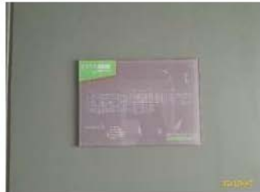
ป้ายบอกชั้นและแผนผังอาคาร