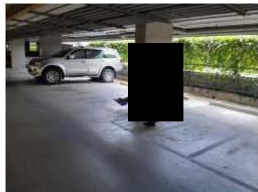
การทำความสะอาดถนน และพื้นที่จอดรถ