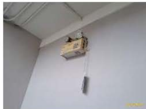
ไฟฉุกเฉิน