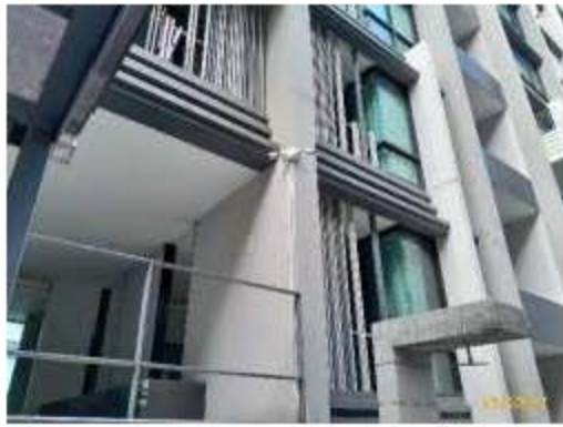
กล้องวงจรปิดบริเวณสระว่ายน้ำ