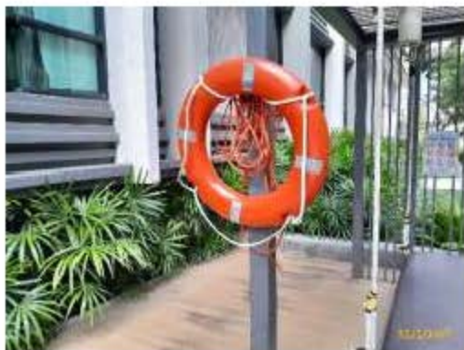
ห่วงช่วยชีวิต