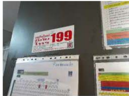
แผ่นป้ายเบอร์โทรฉุกเฉิน