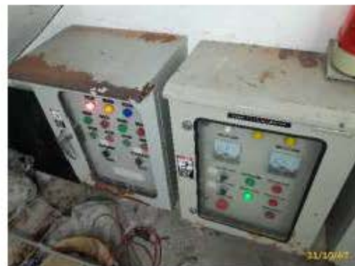
ระบบบำบัดน้ำเสียอาคาร A