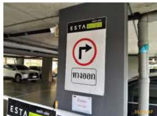
ป้ายจราจร และสัญลักษณ์บนพื้นทาง