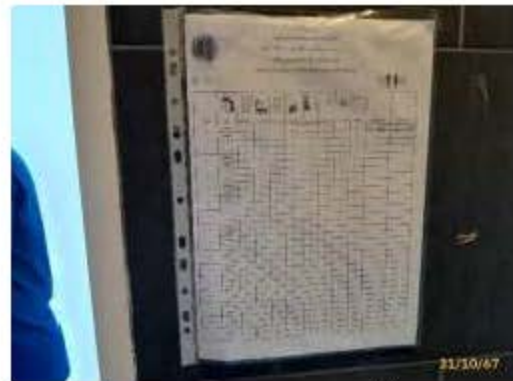
ใบบันทึกการทำความสะอาดห้องน้ำ-ห้องส้วม