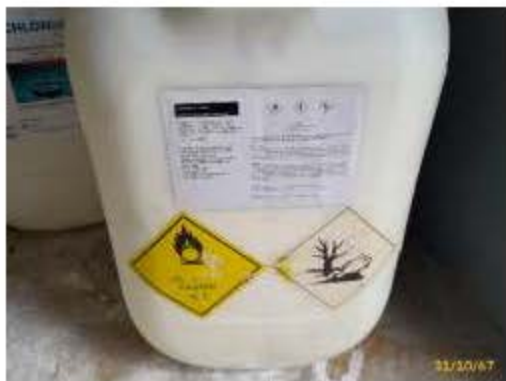
ฉลากสารเคมีที่ใช้ในสระว่ายน้ำ