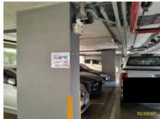
ป้ายกรุณาดับเครื่องยนต์