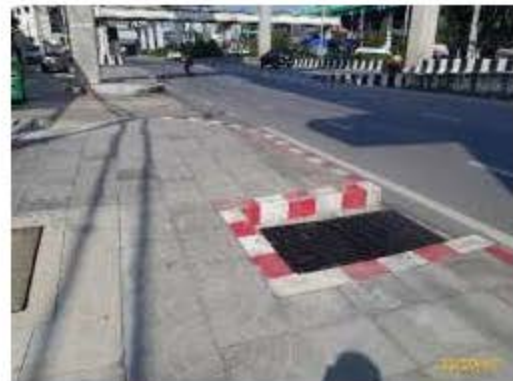
สัญลักษณ์ขาวสลับแดงบริเวณทางเข้า-ออก