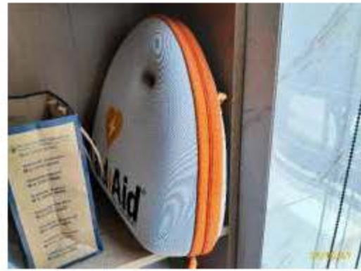
ชุดปฐมพยาบาล