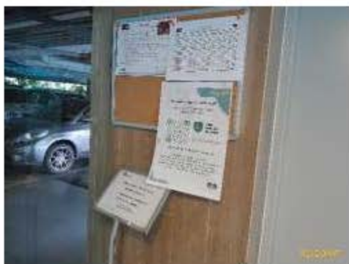
บอร์ดประชาสัมพันธ์