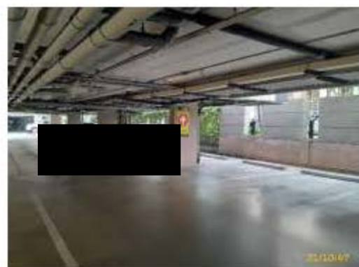
พื้นที่จอดรถ