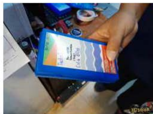
เครื่องมือที่ใช้ตรวจวิเคราะห์ปริมาณคลอรีน/ความเป็นกรด-ด่าง