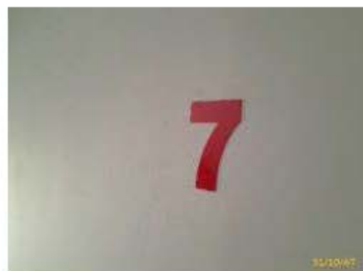
หมายเลขชั้น