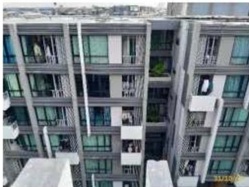
ราวบันไดกันตก 1.2 เมตร