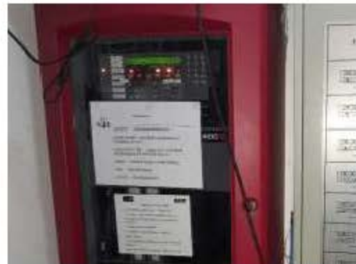
แผงควบคุมระบบสัญญาณแจ้งเหตุเพลิงไหม้