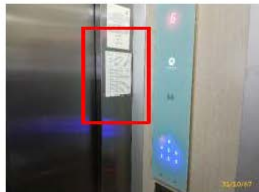
ประตูลิฟต์ พร้อมใบตรวจสอบประจำเดือน