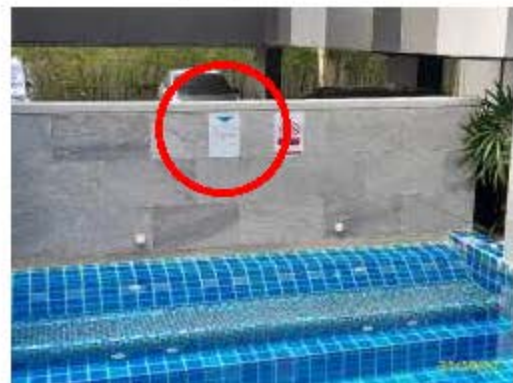
ป้ายบอกความลึก