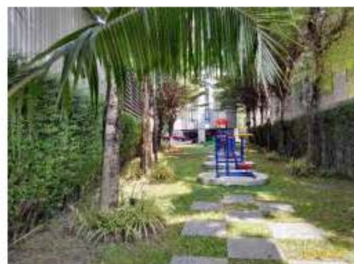
แนวรั้วพื้นที่โครงการที่ติดลำบึงสาธารณะ และระยะห่างจากตัวอาคาร