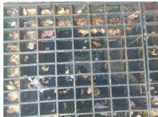
บ่อพักน้ำสุดท้าย