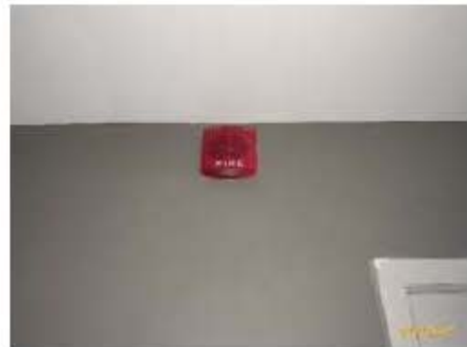
อุปกรณ์ส่งสัญญาณเตือนไฟไหม้