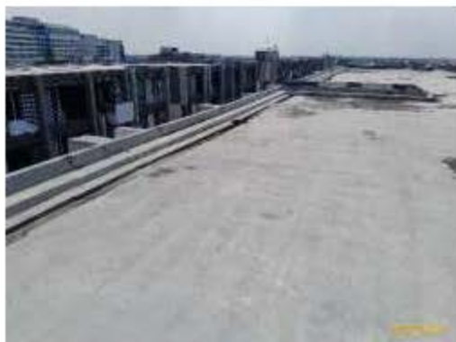
ภาพที่ 2.2-11 (ต่อ) การบริหารจัดการระบบไฟฟ้าและการอนุรักษ์พลังงาน