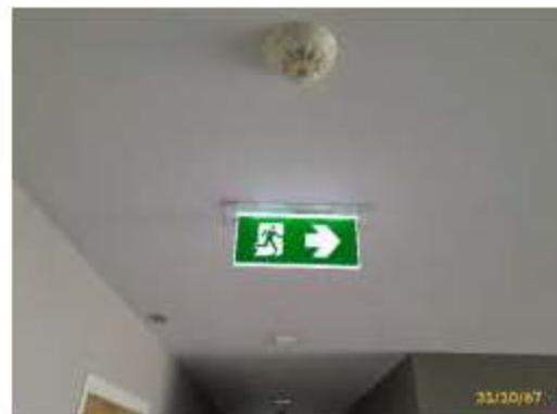
ป้ายบอกทางหนีไฟ