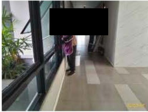
พนักงานทำความสะอาดขณะปฏิบัติหน้าที่