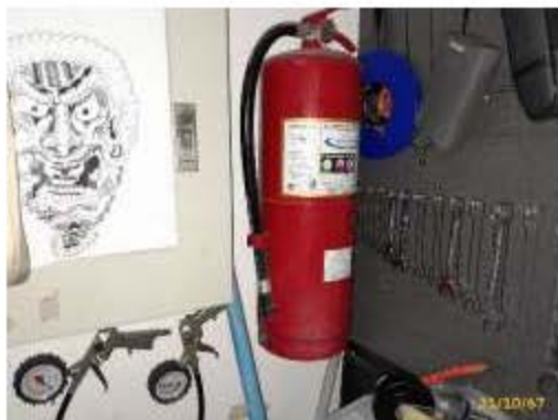
เครื่องดับเพลิงแบบมือถือ