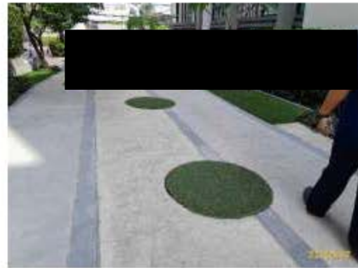
ระบบบำบัดน้ำเสียอาคาร A (ต่อ)