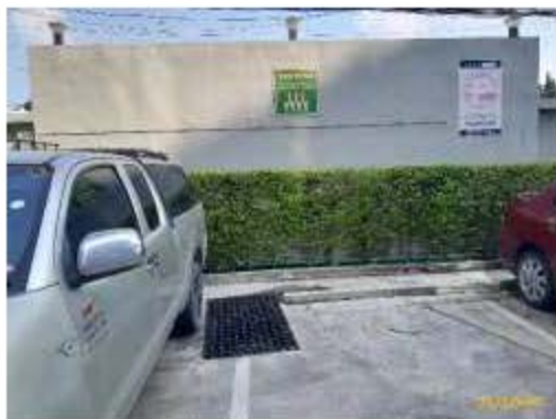
จุดรวมพล