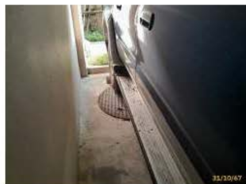
ระบบจ่ายน้ำอาคาร A