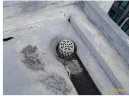
ตะแกรงครอบท่อระบายน้ำ