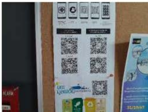
ประชาสัมพันธ์ (ประหยัดน้ำ, ประหยัดไฟ, แผ่นดินไหว และเพลิงไหม้)