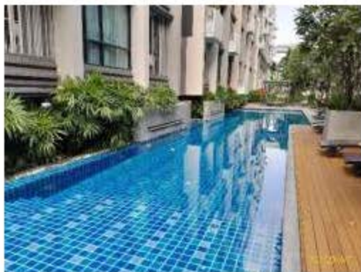
ทางขึ้น-ลง สระว่ายน้ำ