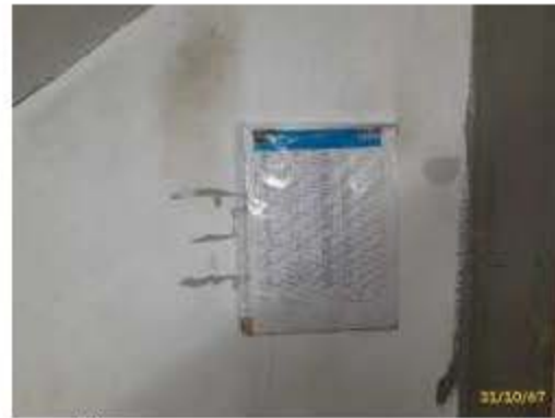
การบำรุงรักษาระบบบำบัดน้ำเสีย