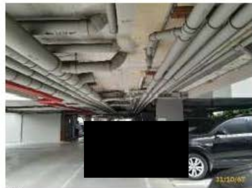
ระบบท่อรวบรวมน้ำเสีย