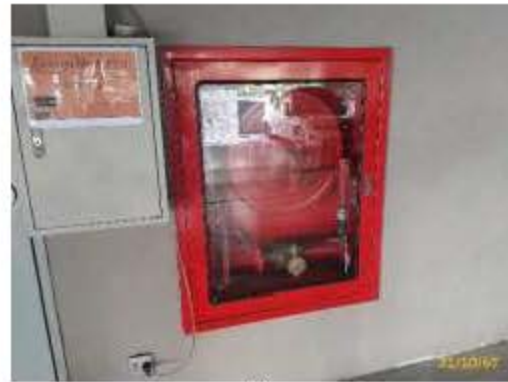
ตู้หัวฉีดน้ำดับเพลิง