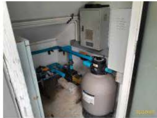
ห้องเครื่องระบบสระว่ายน้ำ