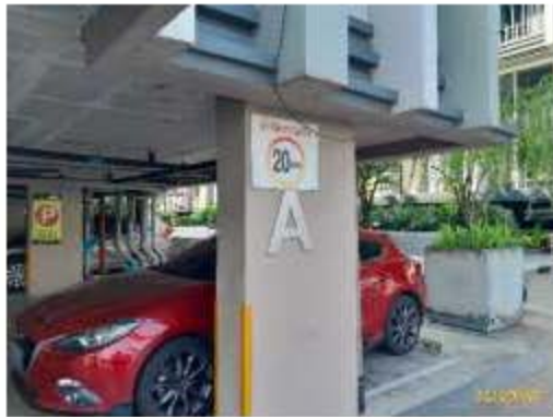
ป้ายจำกัดความเร็ว