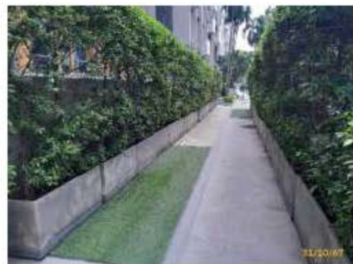
แนวเขตรั้วสระว่ายน้ำ และต้นไม้ระหว่างอาคาร A และ C