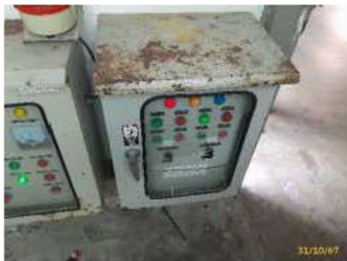
ภาพที่ 2.2-6 (ต่อ) การบริหารจัดการด้านความปลอดภัย