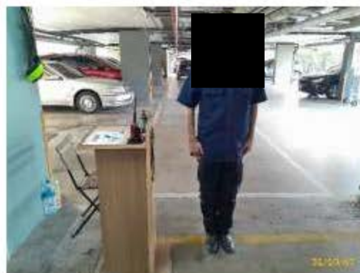
เจ้าหน้าที่รักษาความปลอดภัยประจำอาคาร