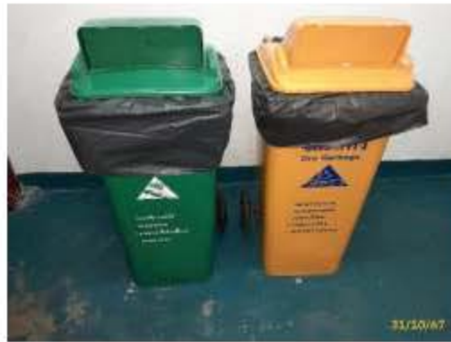
ถังรองรับมูลฝอยเปียก และถังรองรับมูลฝอยแห้ง ภาพที่ 2.2-10 (ต่อ) การบริหารจัดการขยะมูลฝอย