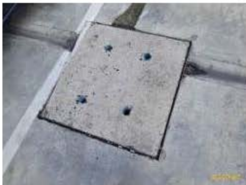
ภาพที่ 2.2-8 (ต่อ) การบริหารจัดการระบบน้ำใช้