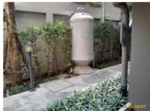
ระบบกำจัด Aerosol และระบบกำจัดมีเทน อาคาร B