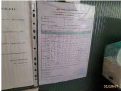
ตารางกำหนดการเข้ากำจัดสัตว์และแมลงนำโรค