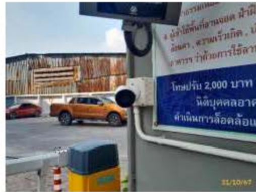
ระบบกล้องโทรทัศน์วงจรปิด (ต่อ)