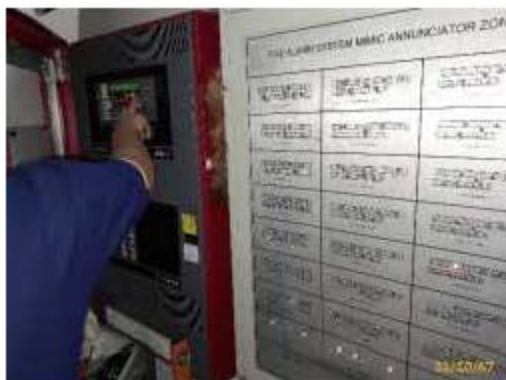
การตรวจสอบระบบป้องกันและระงับอัคคีภัย