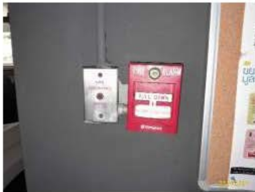
ชุดกดแจ้งเหตุแบบใช้มือ