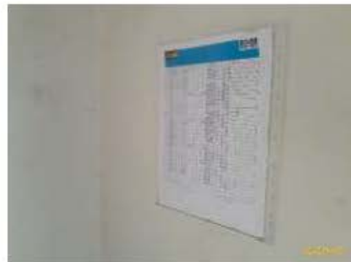
การตรวจสอบระบบน้ำใช้ และเส้นท่อ