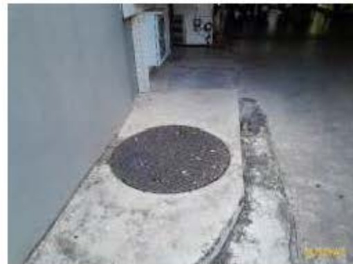
ระบบจ่ายน้ำอาคาร C