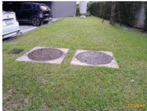
บ่อพักน้ำทิ้ง หรือบ่อบ่ม