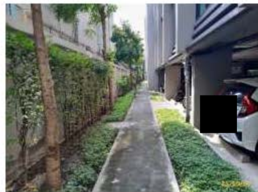
พันธุ์พืชบริเวณพื้นที่จอดรถ